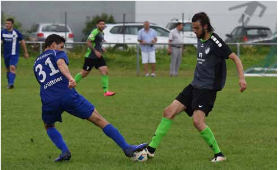
FCW—TSV Hartheim (Freyturnier 2016)