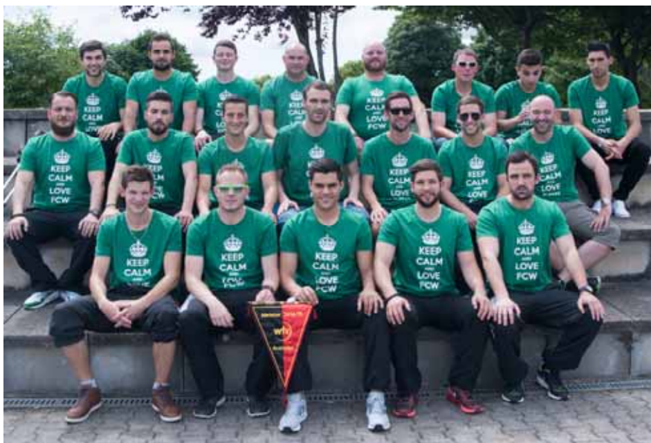
Zur Erinnerung: Bezirksliga-Meister 2014 / 2015