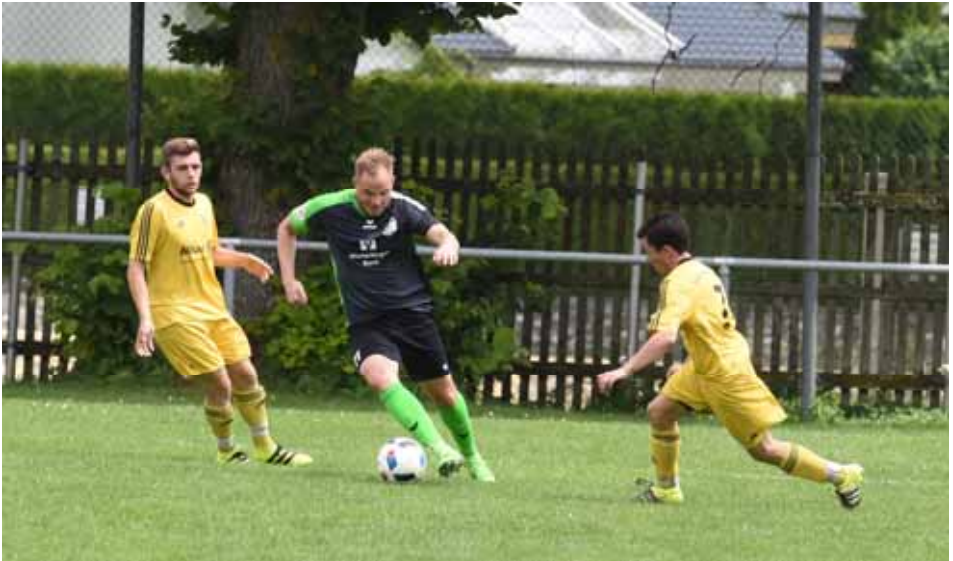
FCW—Spfr. Bitz (Bürgermeister-Frey-Turnier 2016)