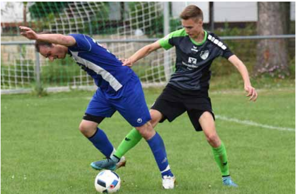
FCW—TSV Hartheim (Bürgermeister-Frey-Turnier 2016)

www.fahrschule-maichle.de E-Mail: maichle.stefan@googlemail.com