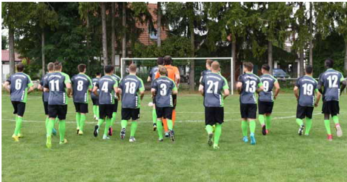
FC Winterlingen 1931 e.V. Grün-Weiß Aktuell Spielzeit 2016/2017