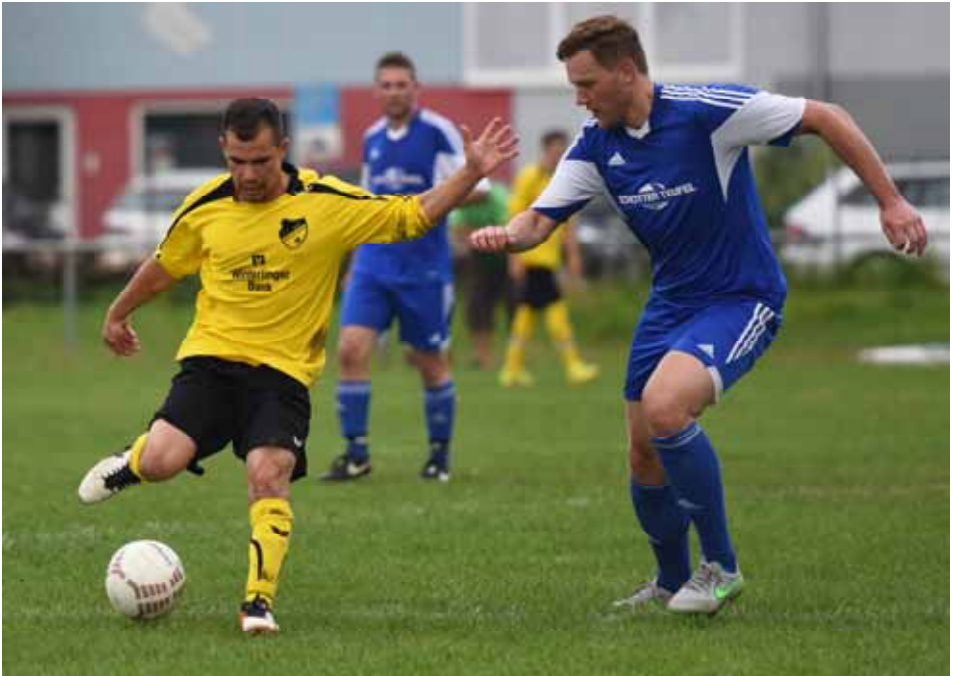
FCW—TSV Straßberg (Bürgermeister-Frey-Turnier 2016)