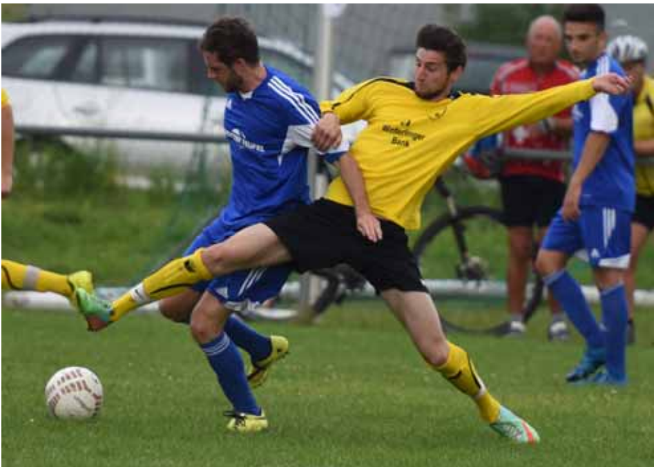
FCW—TSV Straßberg (Bürgermeister-Frey-Turnier 2016)

Albstadt Tailfingen Adlerstr. 37 Tel. 0 74 32/58 58